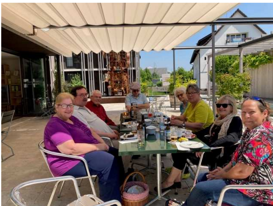
Eine regelmässige Besucherin der Röschenzer Hofgärten hat anlässlich ihres 70. Geburtstages die Bewohner und Bewohnerinnen zu einem spontanen Umtrunk geladen.

Das Bauwerk der Röschenzer Hofgärten bietet durch ihre Architektur eine spezielle Wohnform an, welche die Bewohner gleichsam zu einer Familie vereinen lässt. Verantwortlich dafür sind grosszügig und hindernisfrei gestaltete Wohnungen, welche sich in ihrer starken Lichtdurchflutung auszeichnen. Deren exzentrische Gestaltung ermöglichte eine verschränkte Anordnung, sodass durch die versetzten Zugänge trotz ihrer nahen Abstände zueinander eine Individualität dennoch gewährleistet bleibt. Das im Bau integrierte Kulturcafé lädt zu spontanen Treffs ein, wo auf diese Weise ein Gedankenaustausch