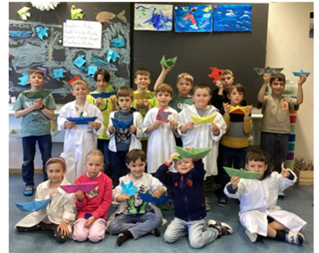
Bericht von Schülerinnen und Schüler aus der Kreisschule Röschenz